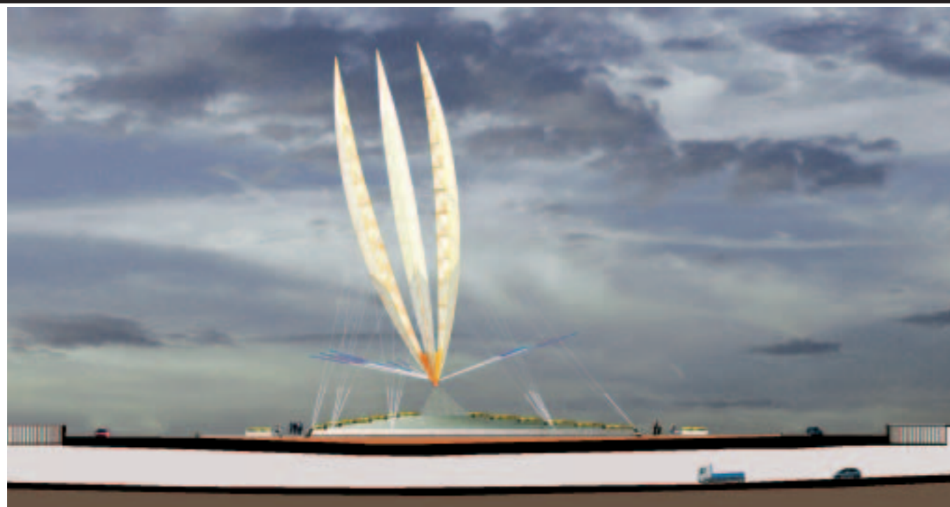
Ed Carpenter, Trillian , scultura-portale/ Gateway Sculpture , Belfast, Northern Ireland 2005.